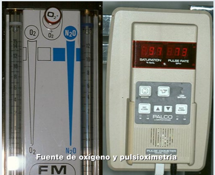
Fuente de oxígeno y pulsioximetría

Finalmente, en cirugías más amplias o en determinados casos de implantología . La sedación endovenosa debe aplicarla siempre un médico anestesista.