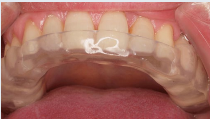
Férula de descarga oclusal

El mantenimiento de la férula es simple: con un cepillado de esta y visitas a su odontólogo con una frecuencia determinada por el mismo para realizar controles y pequeños ajustes, es más que suficiente.